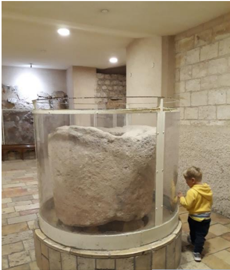
Один из каменных водоносов в Кане Галилейской