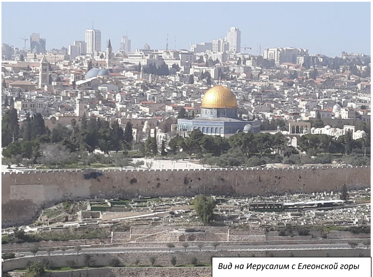
Вид на Иерусалим с Елеонской горы