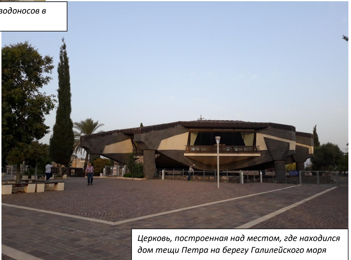
Церковь, построенная над местом, где находился дом тещи Петра на берегу Галилейского моря