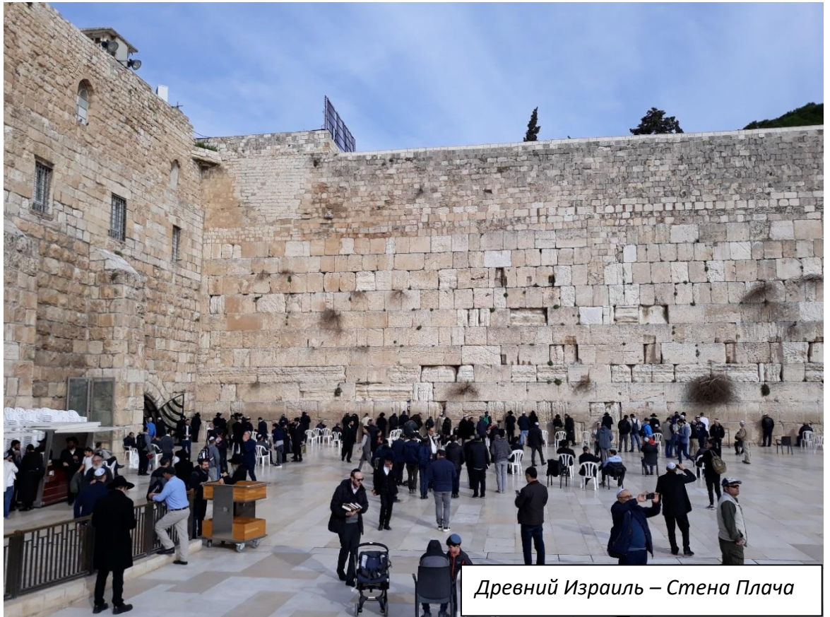
Древний Израиль – Стена Плача