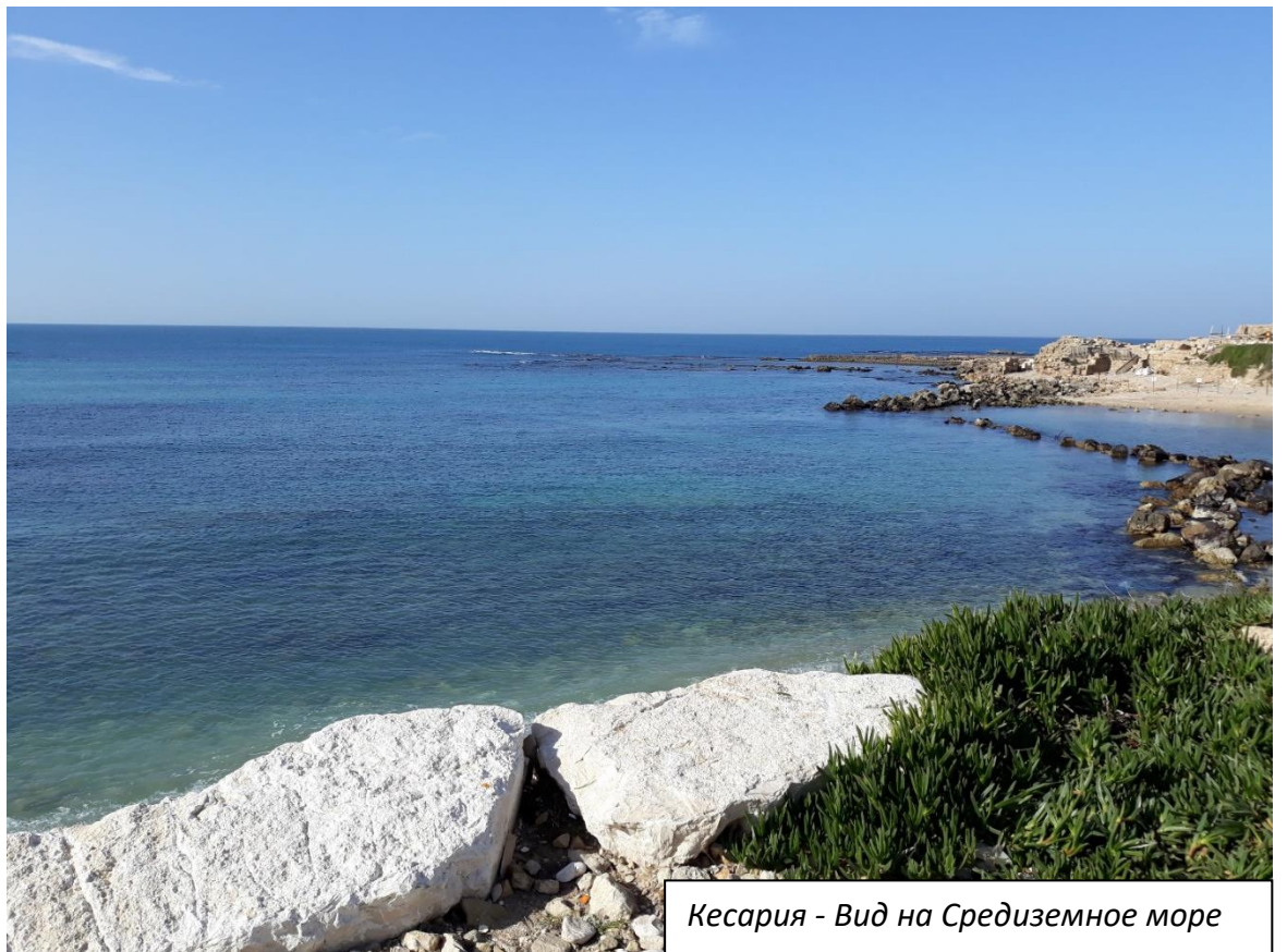
Кесария - Вид на Средиземное море