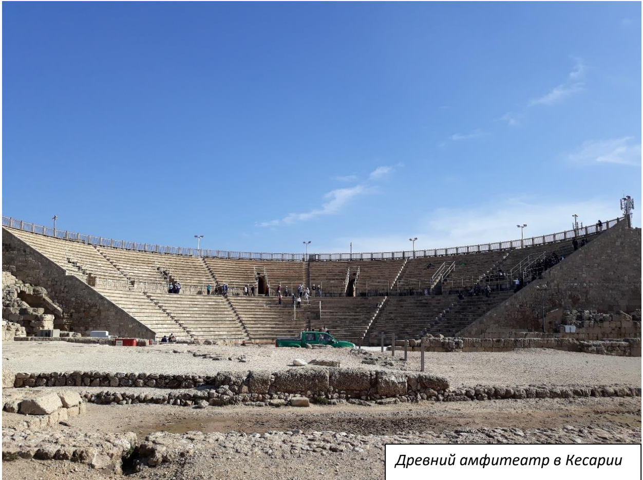
Древний амфитеатр в Кесарии