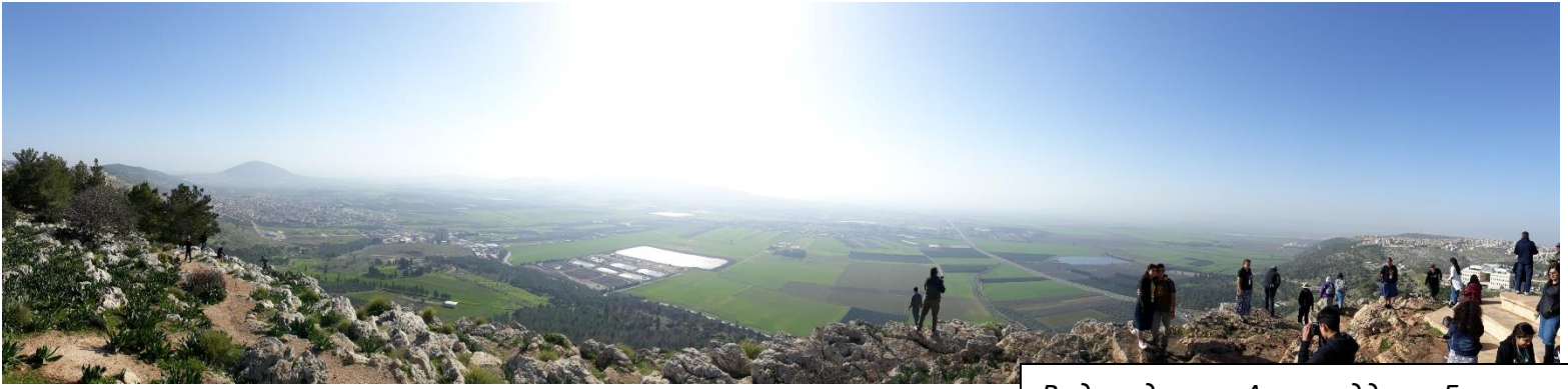
Вид на долину Армагеддон в Галилее